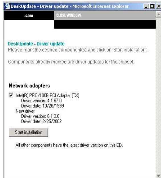
Рис. 2 Инсталляция драйверов вручную

Для инсталляции новой ПК-системы лучше всего подходит OEM DUCD. Сразу после инсталляции запускается DUCD. Он запускается автоматически и предлагает как полностью автоматическую инсталляцию драйверов и Hot-Fixes, так и соответственно инсталляцию вручную. После инсталляции при необходимости производится перезапуск системы. После этого все драйверы и компоненты материнской платы находятся в соответствии со стандартом CD.