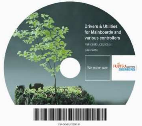
Рисунок 1 OEM Driver&Utility CD

Автоматизация инсталляции драйверов или update-драйвера (обновление) означает огромное облегчение для пользователя. Поиск правильного драйвера выпадает полностью и не один драйвер не забывается. Загружаются только те драйверы, которые были протестированы и одобрены Fujitsu Siemens Computers. Соблюдается даже оптимальный порядок записи, и все драйверы устанавливаются за раз так, что в конце нужно только перезапустить систему. Все это означает быстрый, основательный и без риска Update вашей инсталляции.